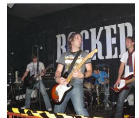
Klassischer Rock ganz modern: Pay*ola aus Nordirland. Foto: Agentur, Abdruck honorarfrei